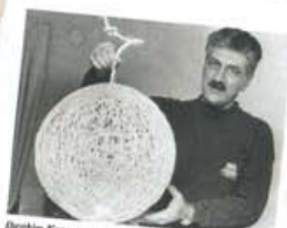
Brahko Katamovic skulle gärna börja tillverka lampor i olika storlekar. Eftersom det är el-lampor måste de vara 5-märkta och hur han ska lösa den delen vet han inte då.

I ett klipp från 1992 visar Brako upp sin lampa, nio år innan Moooi lanserade Random Light .