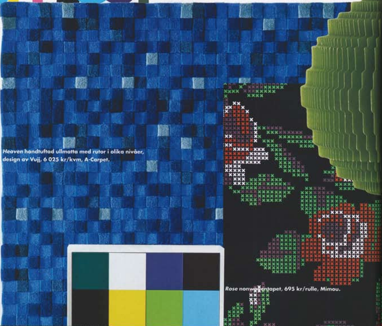
Heaven handtuftad ullmatta med rutor i olika nivåer, design av Vuji, 6 025 kr/kvm, A-Carpet.