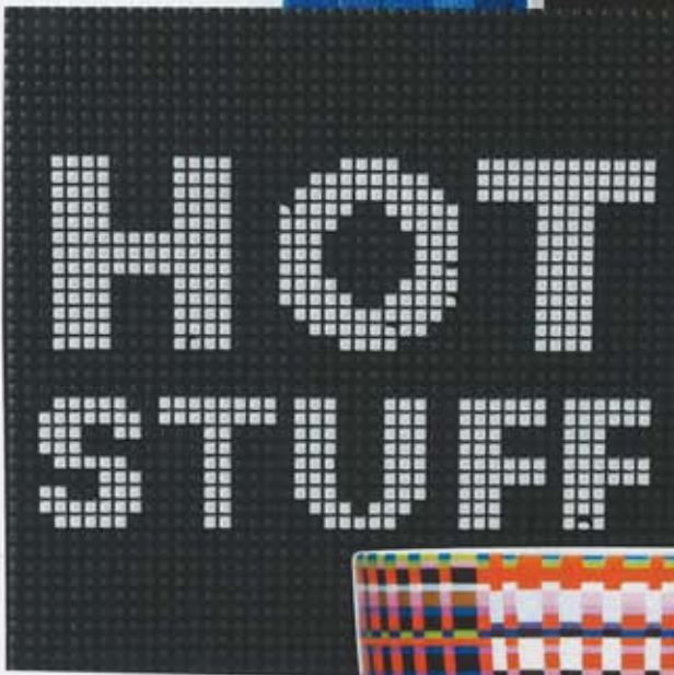
Grytunderlägg i silikon, 49 kr, Lagerhaus.