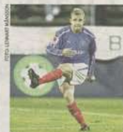
Åtvidaberg satsar hemvävt SPORT 4

Skärpta krav. Om inte frågan om flyktingbarnen blir löst riskerar kommuner en ny tvångslag, skriver regeringens flyktingsamordnare. DEBATT 5