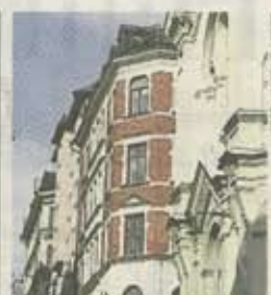
Prisgapet ökar på bostäder EKONOMI 2-3